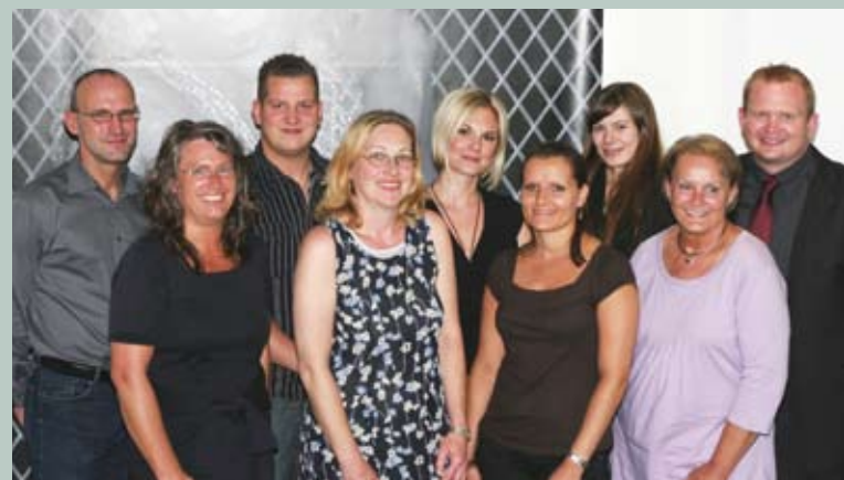
Dienstleistung mit Gesicht – einige Mitarbeiter des VEDA-Outsourcingteams