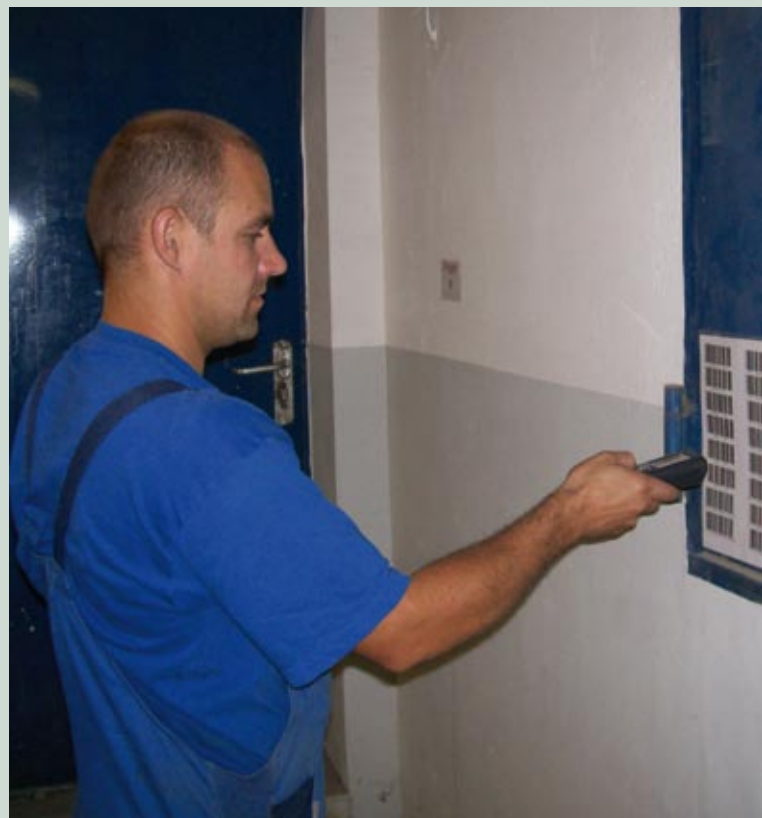
Kostenstellenbezogene, mobile Zeiterfassung: Einfach für die Mitarbeiter, wertvoll für das Unternehmen.